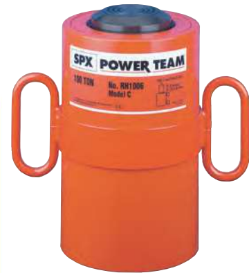
30, 60, 100 Tonnen, doppeltwirkend mit Außengewinde.