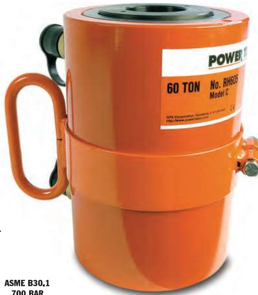
ASME B30.1 700 BAR

• Alle Zylinder mit Kupplungshälften mit 3/8-Zoll-NPT-Anschlußgewinde (Nr. 9796). Die 60- bis 200-Tonnen-Zylinder sind mit abnehmbaren Tragegriffen ausgerüstet.