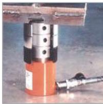
Die Abbildung zeigt den Stützring im Einsatz mit einem 30-Tonnen-Kurzhubzylinder RSS302. Weitere Informationen auf Seite 40.